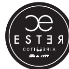
PREMIÀ DE MAR FB: Cotilleria Ester Corseteria Lenceria