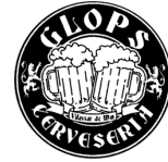
VILASSAR DE MAR glopsvilassar.com