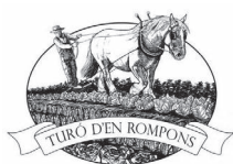
MARSEME – BARCELONA turodenrompons.cat