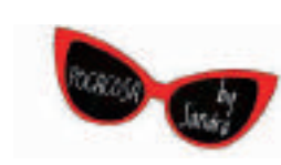
RIBES DE FRESER pocacosa.net